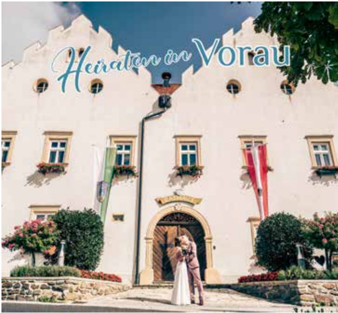
Vorau bietet den Heiratswilligen zahlreiche Möglichkeiten, den schönsten Tag des Lebens zu erleben.