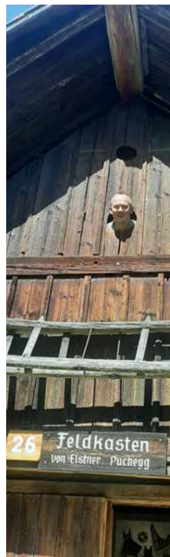
Wolfgang Romirer blickt voll Optimismus in die Zukunft des Freilichtmuseums

Dem scheidenden Obmann war es bei der Jahreshauptversammlung ganz wichtig, allen für ihre bisherige Mitarbeit zu danken und dem neuen Team viele gute Ideen und zahlreiche Besucher:innen zu wünschen.