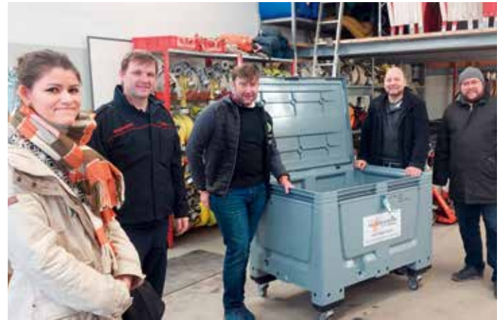
Die Feuerwehr unterstützte die Veranstaltung mit einer informativen, anschaulichen Vorführung