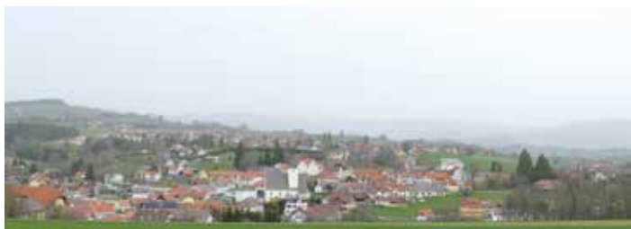
Feinster Saharasand liegt über Vorau