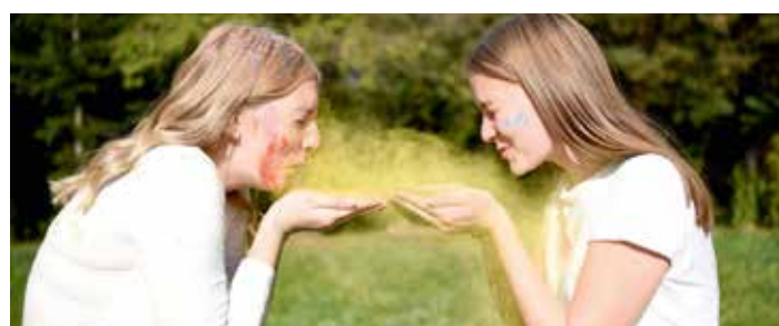
Schulalltag „frech, wild, wunderbar“