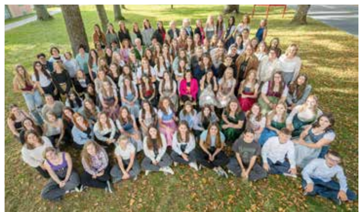
Miteinander – Sinnbild und Leitbild der Fachschule