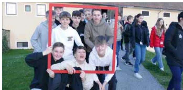
Eine Gruppe von Vorauer Firmlingen vor dem Stift Vorau