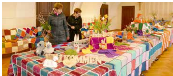
Die Strickdeckenausstellung im Vorauer Pfarrheim war mehr als eine Woche zur freien Besichtigung geöffnet

Die gesamte Karwoche bis hin zum Ostermontag war die Strickdeckenausstellung der Pfarre Vorau zu besichtigen. 45 Strickdecken, 64 Hauben, 27 Schals, 17 Paar Handschuhe, 76 Paar Socken und 13 Kinderpullover waren zu bestau-