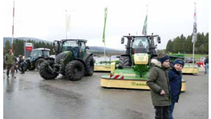
Die neuen Traktoren waren natürlich bei den Jüngsten der Anziehungspunkt

An drei Tagen hatten alle Bäuerinnen und Bauern, aber auch all jene, die sich für Land- und Forstmaschinen aber auch für Gartengeräte und Neuwagen interessierten, am gesamten Betriebsgelände von Landmaschinen Gaugl in Vornholz die Möglichkeit, sich über den neues-