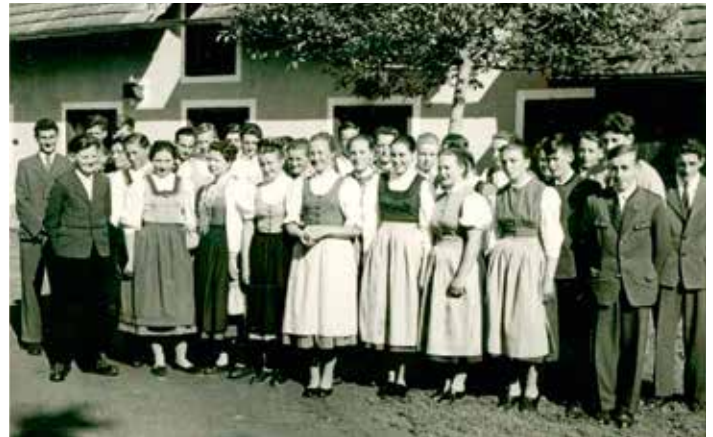
Lehrfahrt 1960, Hof Rolke in Söding

Der Blick in die Zukunft ist geprägt von Optimismus und Engagement sowie der Entschlossenheit der Fachschule Vorau, weiterhin eine Vorreiterrolle in der Bildung zu spielen und die nächsten 100 Jahre mit Innovation und Einzigartigkeit zu gestalten.