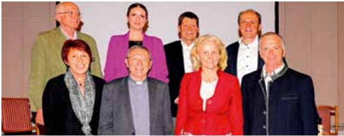
Der neue Vorstand der Frühjahrsakademie präsentierte sich erstmals im Barocksaal des Stiftes

Ausgaben des Landes. Um hier zu sparen ist es notwendig, das Gesundheitsbewusstsein der Bevölkerung zu heben, damit die Zahl der gesunden Lebensjahre ansteigt.